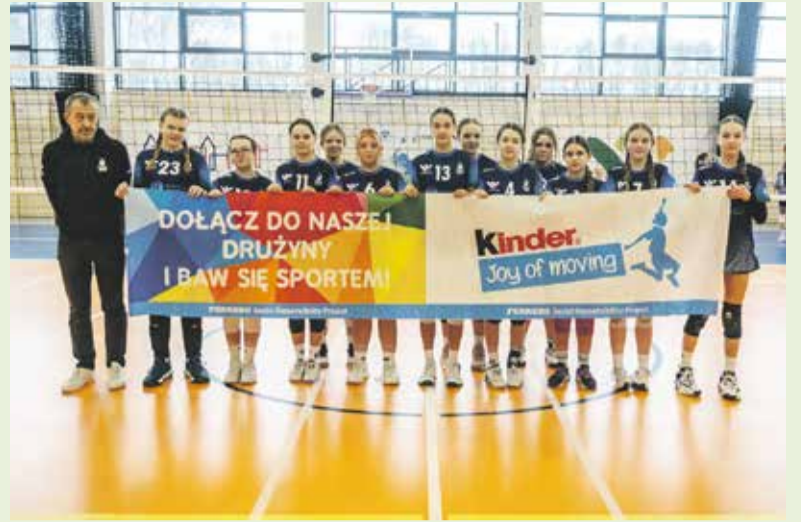
Dolnośląska Siatkówka Kinder Joy of moving Mini-siatkówka w mistrzowskim

I już na koniec: mnóstwo pięknych zdjęć zrobił Bartosz Bober Fotografia - łapcie, udostępniajcie i lajkujcie!