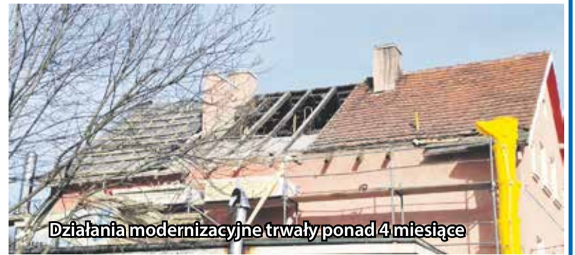
Działania modernizacyjne trwały ponad 4 miesiące

tyki Społecznej programu skierowanego do podmiotów ekonomii społecznej pn: Odporność oraz rozwój ekonomii społecznej i przedsiębiorczości społecznej na lata 2022-2025. Było to 200 milionów złotych z Krajowego Programu Odbudowy, z których mogły skorzystać m.in. organizacje pozarządowe. Przygotowany przez nas projekt otrzymał dofinansowanie – mówi prezes Forum Aktywności Lokalnej. Zaplanowana inwestycja mogła być realizowana. My musieliśmy pokryć ze środków własnych podatek VAT – dodaje Arkadiusz