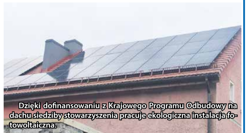
Dzięki dofinansowaniu z Krajowego Programu Odbudowy na dachu siedziby stowarzyszenia pracuje ekologiczna instalacja fotowoltaiczna.

Czocher. Wybór wykonawców oraz niezbędne prace modernizacyjne i instalacyjne trwały ponad 4 miesiące. Dzisiaj, szczególnie w słoneczne dni, zainstalowane panele fotowoltaiczne produkuje nawet 100 kWh