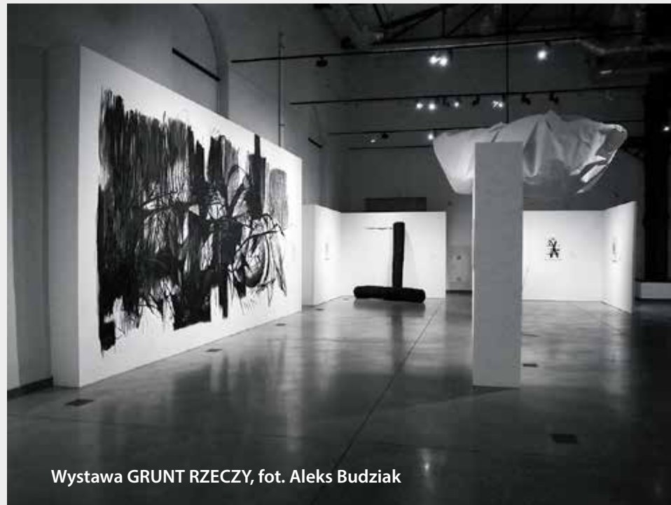
Wystawa GRUNT RZECZY

Kurator wystawy: Jarosław Michalak WYSTAWA „EUGENIUSZ KISZCZAK –