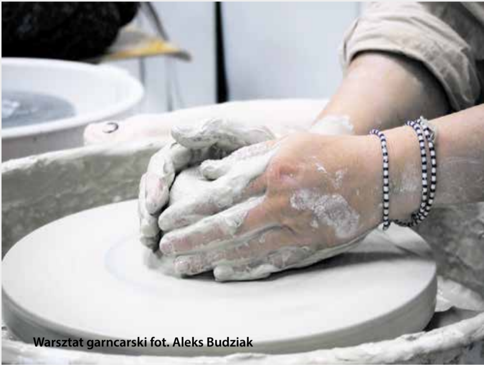
Warsztat garncarski